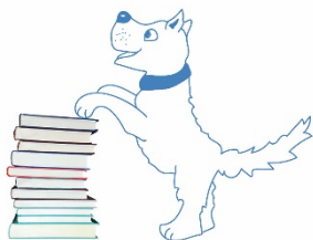
HELFENDE TIERE Leselernhund-Team